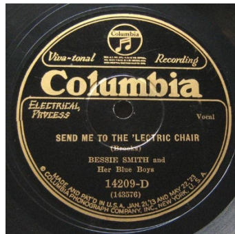
Send Me To The 'Lectric Chair