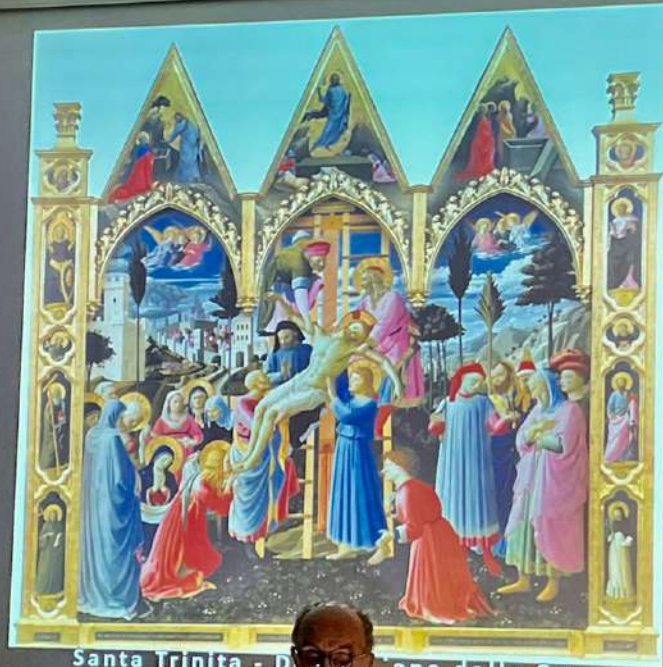
Santa Trinita - Descente dalla Croce