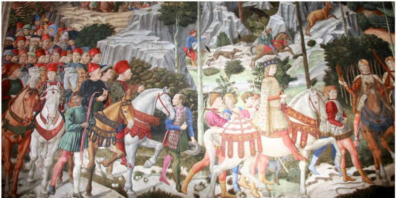
Benozzo Gozzoli – Cappella dei Magi in Palazzo Medici – Particolare

Benozzo Gozzoli - La Cappella dei Magi Nel Palazzo di Cosimo in via Larga